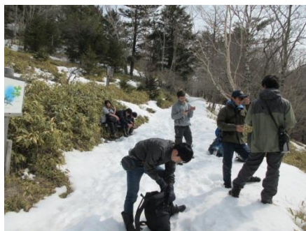
大菩薩峠までの登山（2日目）