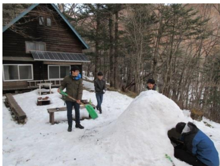
ヒュッテの庭での「かまくら」作り