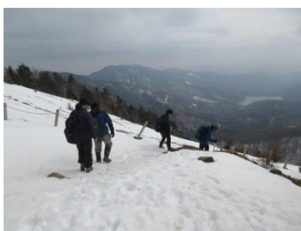
展望を楽しみながら唐松尾根を下山