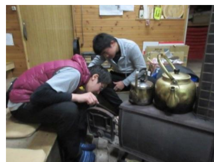
まきストーブの着火に挑戦

理科研究部では、屋内での研究活動と合わせて、野外での活動（芝川の調査、地震・津波の調査、上記のような合宿）もおこなっています。縁がありましたら、ぜひ入部していただければ幸いです。