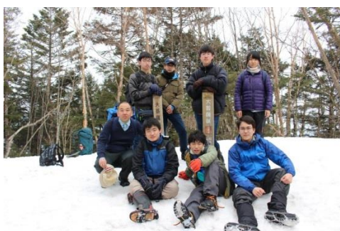
日本百名山の菩薩嶺へも登頂