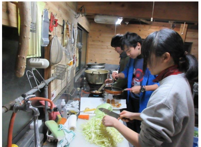
2日目の夕食(理研オリジナル定食)の準備

今回は、天候にめぐまれ、また部員間の信頼関係の強さによって、目的以上のレベルの活動を経験できました(次頁の写真をご覧ください)。