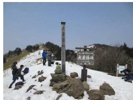
大菩薩峠へ登頂（峠で雪合戦）