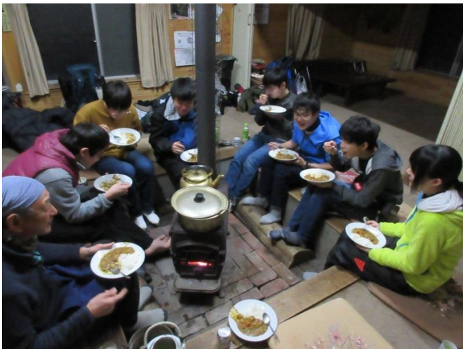
1日目の夕食(カレーライス)

食事はすべて自炊をしました。食事の準備や後片付けも含め、3日間協力し合いまたお互いの体調を気遣い合い、合宿の目的の1つとしていた部員間の交流も自然と深まりました。