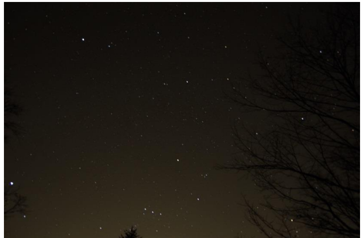
天体観測の様子と部員が撮影した星空(合宿1日目(3月28日)の夜)

食事はすべて自炊をしました。食事の準備や後片付けも含め、3日間協力し合いまたお互いの体調を気遣い合い、合宿の目的の1つとしていた部員間の交流も自然と深まりました。